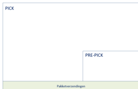
Figuur 1 – Standaard magazijn

Onderstaand een schematische weergave van de magazijnindeling voor een standaard magazijn en een WMS gestuurd magazijn.